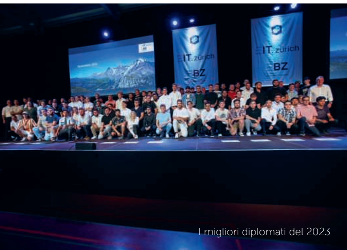
I migliori diplomati del 2023