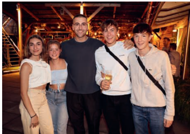
I tirocinanti, felici di ritrovarsi.