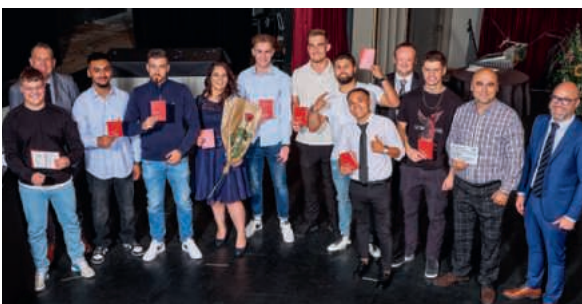
Alcuni dei neodiplomati