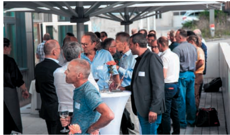
Cena festosa in piedi