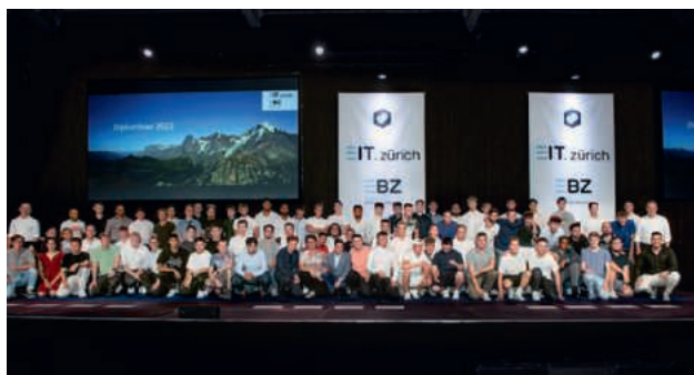
I migliori diplomandi 2022.