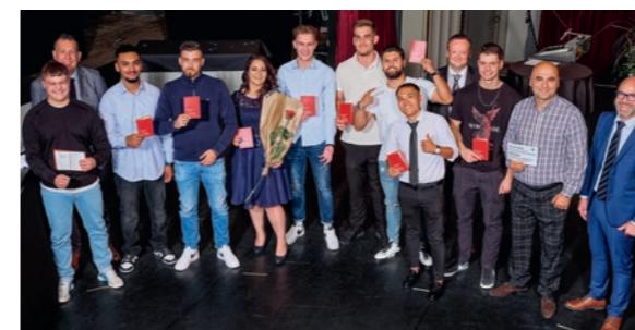
Einige der erfolgreichen Absolventinnen und Absolventen