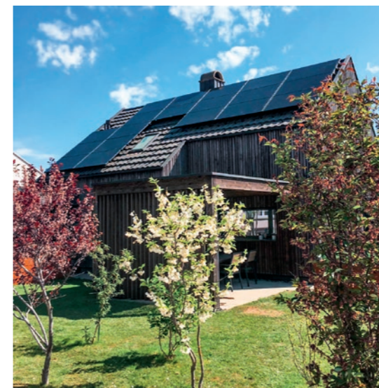
06 | Der Mehrwert liegt auf der Hand Solar ist viel mehr als PV