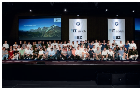
Beste Absolventinnen und Absolventen 2022