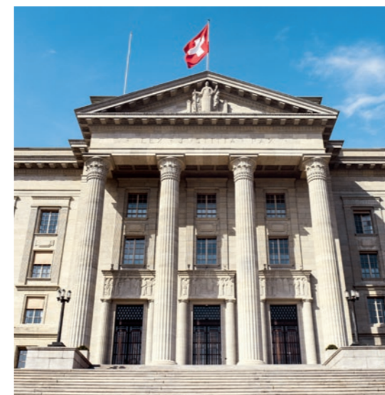
14 | Rechtsdienst Sperrung von Auskünften aus dem Betriebsregister