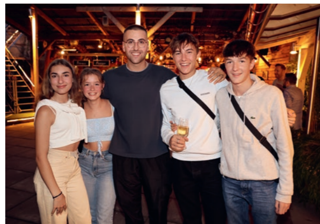
Die Lernenden genossen den Austausch untereinander.