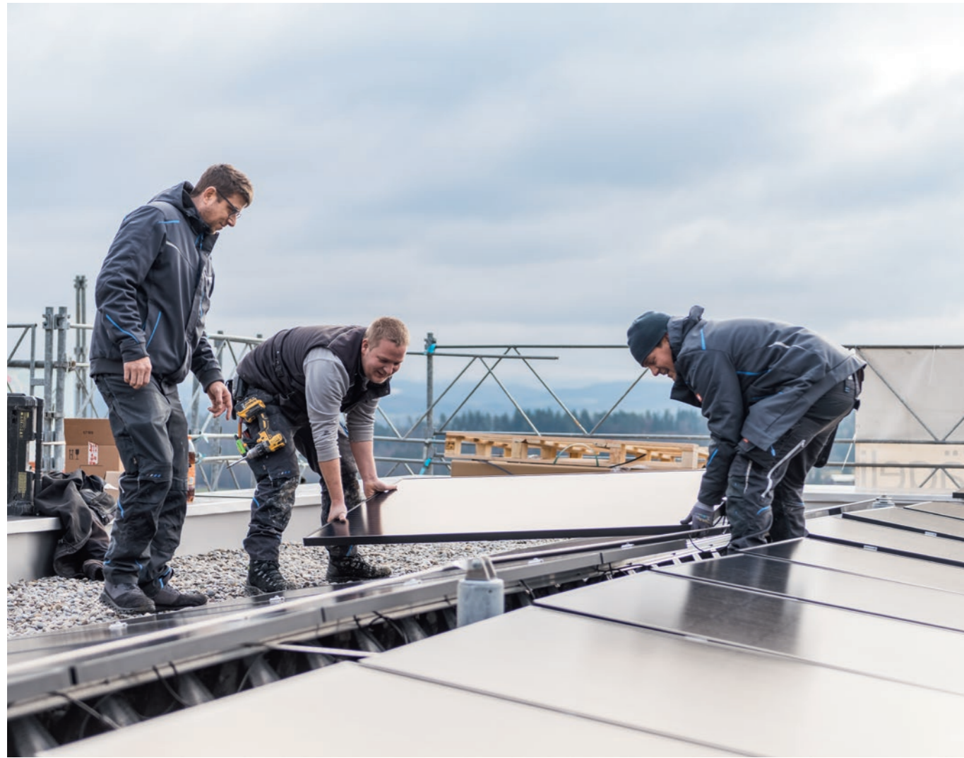
Anpacken für eine nachhaltige Stromproduktion. Für Installateure kein Problem. Im Gegenteil, Teamwork macht sogar Spass.

sie sehen die Anlagen ganzheitlich: Sie sorgen für die Optimierung des Eigenverbrauches im Gebäude, schaffen Zusammenschlüsse zum Eigenverbrauch (ZEV), kennen sich mit Speichersystemen und nicht zuletzt mit Elektromobilität aus. Sie sorgen auch für die intelligente Verteilung der Sonnenenergie im Gebäude mittels Bus-Systemen und IP-Netzwerken sowie für die Vernetzung all dieser Systeme mit dem Smartbuilding oder Smarthome, auf dem die Photovoltaikanlage installiert ist. Kurz gesagt: Eine Photovoltaikanlage bringt nur in Kombination mit Gebäudetechnik einen effektiven Mehrwert.